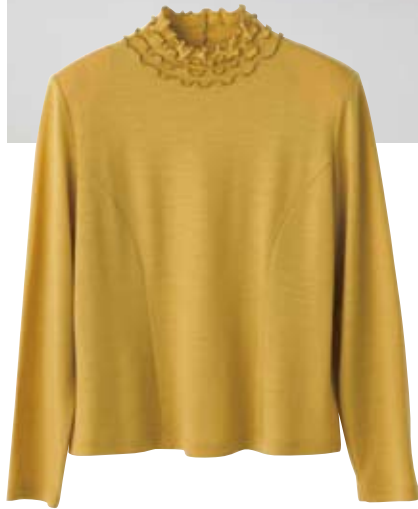
カットソー 126-121 ¥ 9,870 (税込)