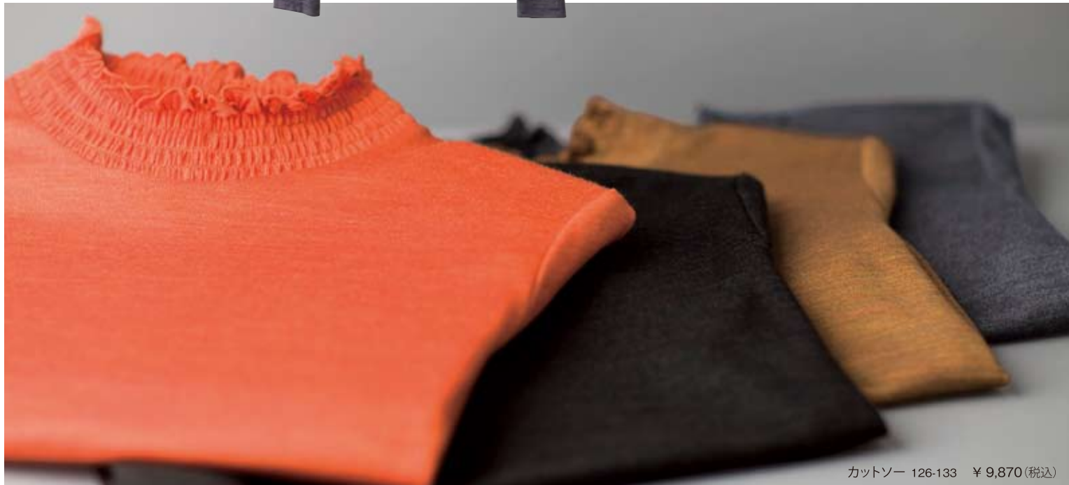
カットソー 126-133 ¥ 9,870 (税込)